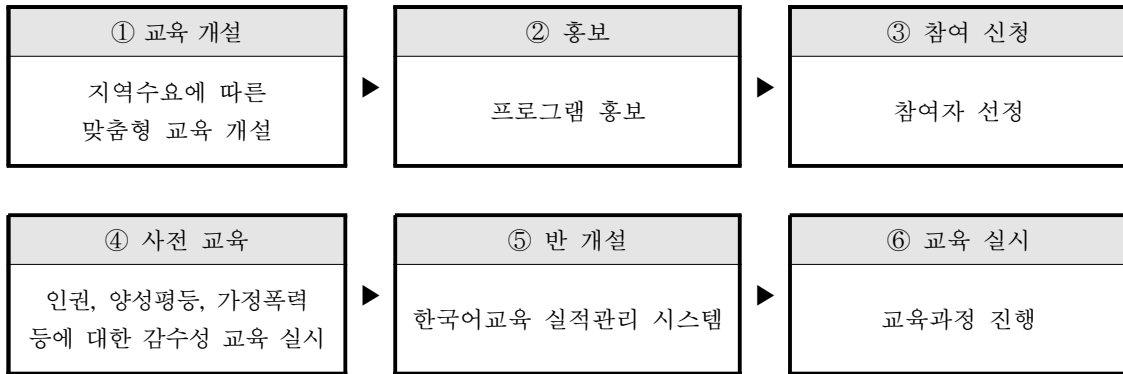
[그림 II-4] 교육 과정 흐름도