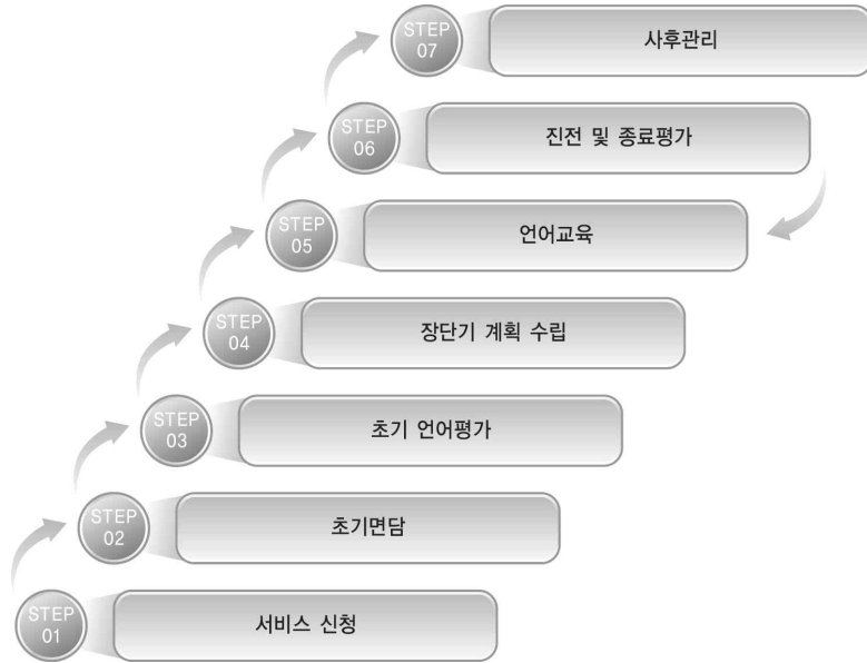
[그림 II-1] 언어발달지원 서비스 과정